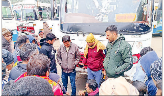
निजी बस को रोकने का प्रयास करते चालक।

के लिए भटकते रहे। हालांकि पहले दिन के मुकाबले दूसरे दिन मिला जुला असर देखने को मिला। इस दौरान यात्रियों को अधिक परेशानियों का सामना करना पड़ा। बसें न चलने के कारण यात्री अन्य साधनों को तलाशते दिखाई दिए दिनभर गहरागहमी का माहौल रहा।