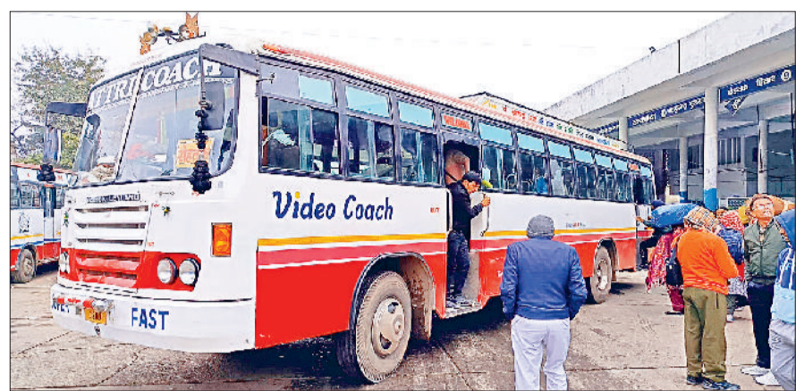
सोनीपत। बस स्टैंड पर खड़ी रोडवेज की बसें।