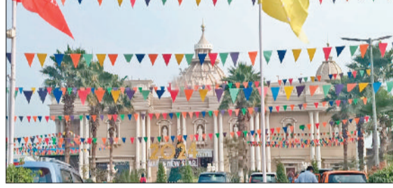
सोनीपत। जीटी रोड पर स्थित ढाबा।