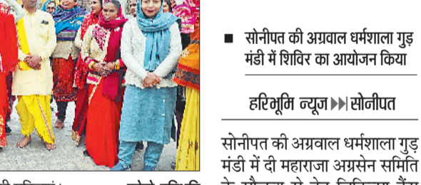
सोनीपत। कैम्प में उपचार के लिए पहुंचे बुजुर्ग।

सोनीपत की अग्रवाल धर्मशाला गुड़ मंडी में दी महाराजा अग्रसेन समिति के सौजन्य से नेत्र चिकित्सा कैम्प लगाया गया। जिसमें की गुरुग्राम डॉक्टरां गांधी नेत्र चिकित्सालय से इंडिया की टीम अग्रसेन समिति के सौजन्य से बुलाई गई थी। जिसमें की आम जनता अपनी आंखों का चेकअप बिना किसी शुल्क के करवाया। इसमें से 20 मरीजों को मोतियाबिंद की शिकायत पाई गई। जिनमें से सभी को आज टीम के साथ ऑपरेशन के लिए भेजा गया। जिनको कोई अन्य बीमारी थी तो