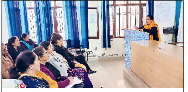
सोनीपत। कार्यक्रम के दौरान मौजूद प्रिंसिपल।