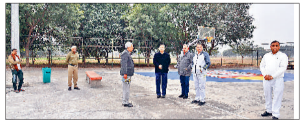
सोनीपत। ग्राउंड का जायजा लेते विवि के अधिकारी।

पारदर्शिता व निष्पक्ष प्रतियोगिता का आयोजन करवाया जाता है। यही कारण है कि विश्वविद्यालय लगातार चौथी अखिल भारतीय स्तर की प्रतियोगिता का आयोजन करा रहा है। यह विश्वविद्यालय के लिए गवर्नर का विषय है। देश भर की टॉप 16 विश्वविद्यालय की टीम प्रतियोगिता में भाग लेंगी, जिसमें 192 महिला खिलाड़ी भाग लेंगी। सफल