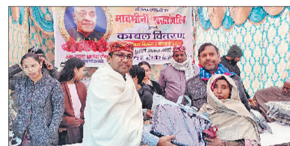
प्रथम पुण्य तिथि के उपलक्ष्य में जरूरतमंदों को कम्बल वितरित करते हुए।