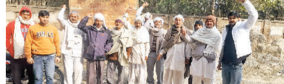
सोनीपत। बैठक के बाद रोष-प्रदर्शन करते पदाधिकारी व सदस्य।