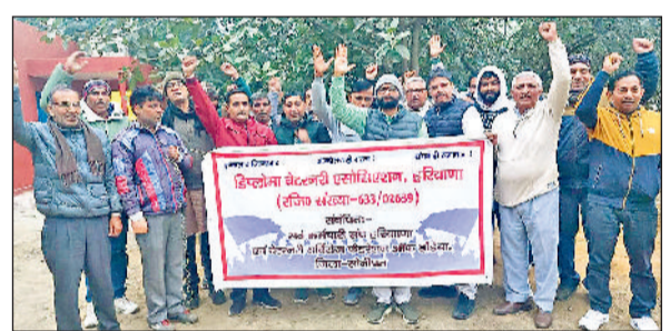
सोनीपत। रोष-प्रदर्शन करते कर्मचारी।

वीएलडीए कर्मियों एवं पशुपालकों की विभिन्न मांगों की अधिसूचना जारी करवाने को लेकर डिप्लोमा वेटरनरी एप्रोसिएशन हरियाणा संबंधित सर्व कर्मचारी संघ हरियाणा द्वारा जून, 2022 से अनिश्चितकालीन आंदोलन चलाया जा रहा है। जिसके अंतर्गत पंचकुला के सेक्टर पांच में पिछले 567 दिनों से रोष स्वरूप धरना प्रदर्शन किया जा रहा है। मुख्यमंत्री द्वारा स्वीकृत